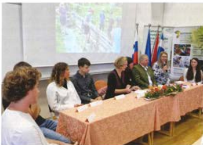
Okrogla miza o sodelovanju z Nockbergom.

Šolsko osebje se je udeležilo različnih strukturiranih tečajev v Španiji, Portugalski in Grčiji. Teme tečajev so bile s področij okoljske trajnosti, učinkovitega upravljanja, vodenja in orga-