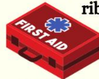
Komplet prve pomoči